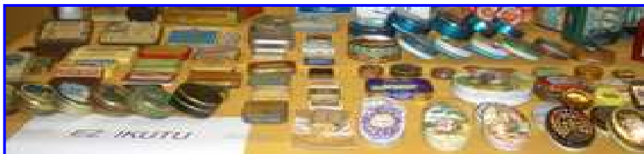
CAJAS METÁLICAS. C. Mayor