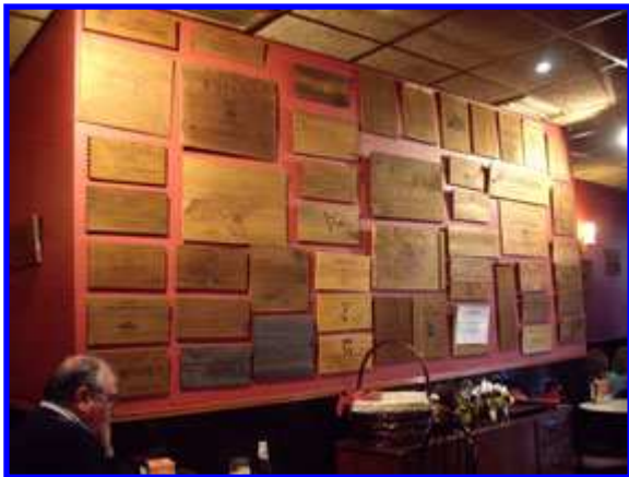
TAPAS DE CAJAS DE VINO