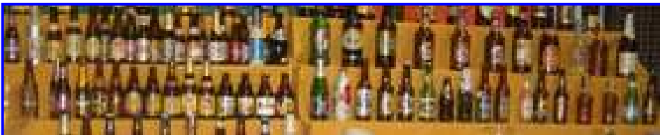
ENVASES DE CERVEZA. BITXIKIAK