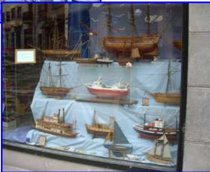
MAQUETAS DE BARCOS