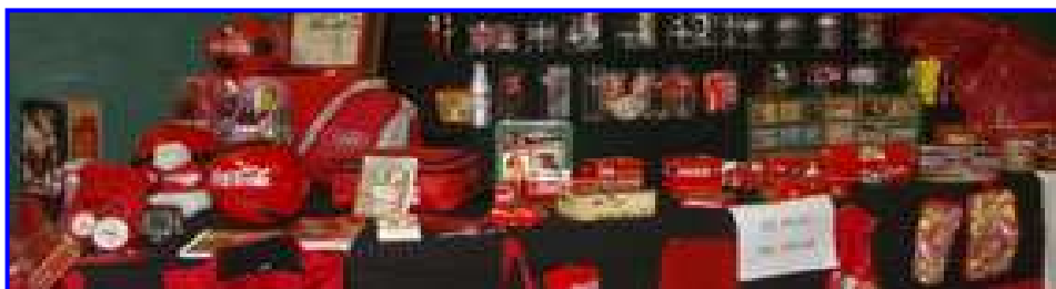
COCA-COLA. J. Galdona