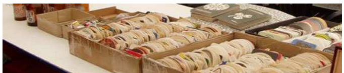
INTERCAMBIO DE POSAVASOS